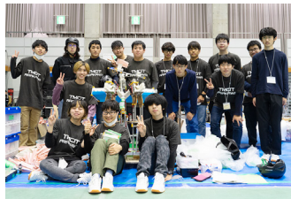
▲会場にて集合写真