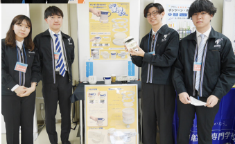
▼AM デザイン部門の 展示ブースの様子