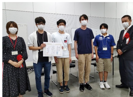
▲大会当日、プロ棋士と共に記念写真

東京都職業能力開発協会「技能検定成績優秀者表彰制度」において成績優秀者として東京都職業能力開発協会会長賞を受賞!