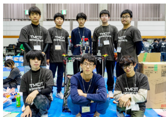
▲Aチーム「全てはいずれ黒に」

2022年10月16日(日)にアイデア対決・全国高等専門学校ロボットコンテスト2022 関東甲信越地区大会が栃木県立県南体育館で開催されました。今年は、3年ぶりの対戦型競技となりました。今年の競技課題は「ミラクル☆フライ〜空へ舞いあがれ!〜」。ロボットが自作の紙飛行機を飛ばして様々なオブジェクトに乗せて点数を競いました。荒川キャンパスAチーム「全てはいずれ黒に」、Bチーム「蒼穹飛」の2チーム出場し、Bチームがマブチモータ特別賞を受賞しました。