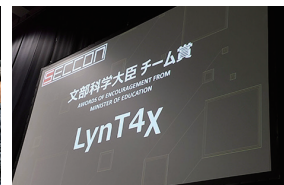
◀SECCON CTF(国内) 当日の様子

ここからは2019年度した半期にFacebook公式ページで注目された記事をご紹介します。