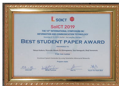
▲Best Student Award の賞状