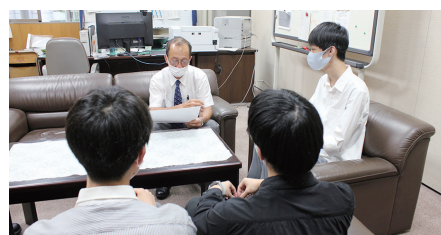
▲渡辺校長への報告の様子