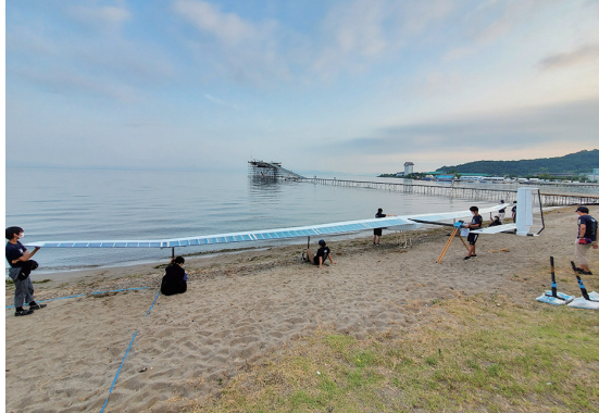
▲フライト直前の様子

荒川キャンパスの人力飛行機研究部Team ЯTRが鳥人間コンテスト2021の滑空機部門に出場しました。今年は新型コロナウイルス感染症の影響により、出場チーム枠が例年の半分に絞られました。本校は、無事、狭き門の書類選考を通過し、2年ぶり(昨年度は中止)に出場権を獲得しました。