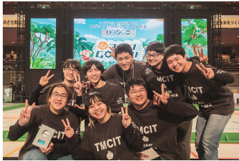
▲全国大会に出場した荒川 A チーム「Fruits full 2」

「アイデア対決・全国高等専門学校ロボットコンテスト2023」にて、高専ロボコン研究部(品川キャンパス)、ロボット研究同好会(荒川キャンパス)が大活躍しました。2023年の高専ロボコンは「もぎもぎ!フルーツG Oラウンド」というテーマで、障害物を乗り越え、高所に設置されているフルーツに見立てたアイテムを収穫するという内容で熱戦が繰り広げられました。