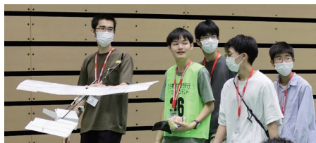
▲チーム「UNIII (ウニィィィ)」と出場機

決勝では、予選を突破した10チームと審査員推薦の2チームの合計12チームで競い、「KANI」は健闘して決勝6位、「SYATI」は善戦して決勝11位でした。