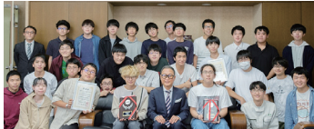
▲ロボット研究同好会 (荒川キャンパス)