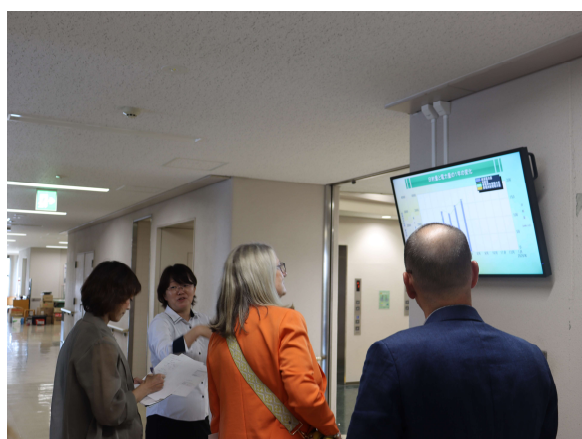
○コース説明の様子