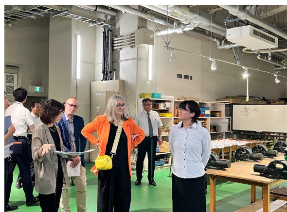
○施設見学(総合工場)